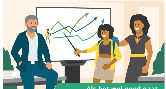
Als het wel goed gaat

Er is geen duidelijk aanspreekpunt voor het zorgtraject, waardoor de communicatie gebrekkig verloopt en afspraken en taken niet voor iedereen helder zijn. De kennis en ervaring van leerlingen en ouders worden in het zorgtraject onvoldoende benut en er is een gebrek aan onderling vertrouwen.